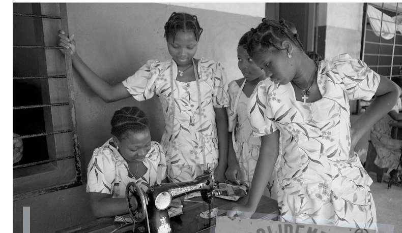
En 2017, 6 jeunes filles ont eu leur diplôme de couture et formation générale

Il accueille cette année 60 jeunes filles en risque de mariage imposé, orphelines, malades en cours de traitement : lèpre, ulcère de buruli...pour suivre des cours de français, maths, couture, cuisine, puériculture... L'objectif est de donner une alternative et un espoir de vie meilleure à des jeunes filles issues de familles indigentes.