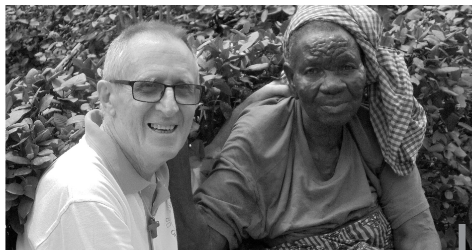
En 2017, plus de 37 000 personnes sont venues en consultation à Davougon

Depuis 30 ans l'Association travaille à ce partage et cette nuit je ne pouvais pas ne pas penser à vous ! En effet, je ne sais combien de flacons de perfusions nous avons