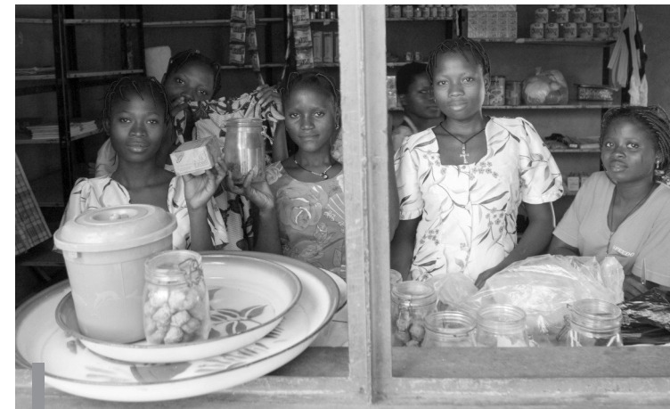
Agées entre 12 et 20 ans pendant leur formation, elles doivent également apprendre à tenir un magasin.