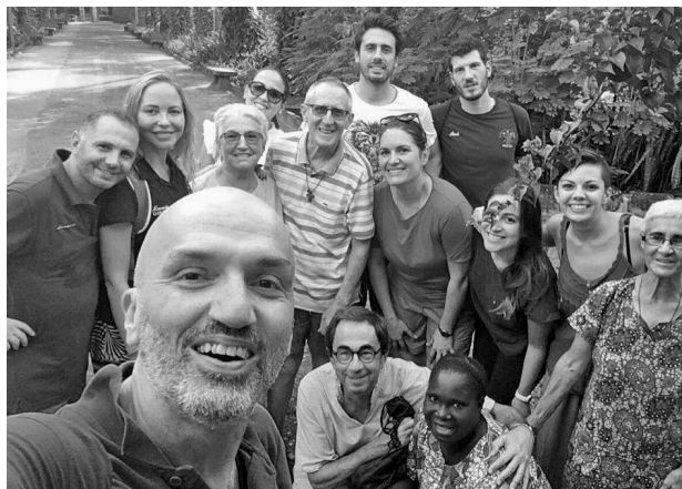
L'équipe chirurgicale de Naples venue en renfort au mois de décembre pendant une dizaine de jours.