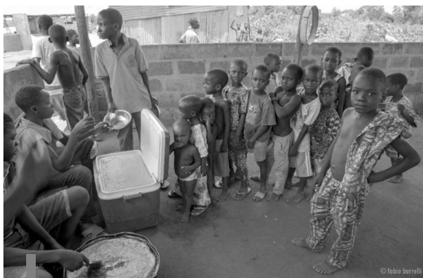
Dans les villages à l'occasion des fêtes, comme des enterrements, un repas amélioré est servi aux enfants (ici près de Zagnanado).